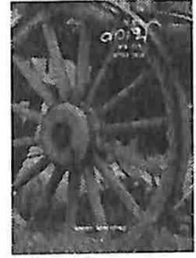
रेखाचित्र : अनुप्रिया

नवलेखन अंक : रचनाएँ आमंत्रित (अन्तिम कवर) (कविता-कहानी-आलोचना)